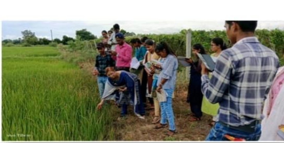
कृषि फार्म का शैक्षणिक भ्रमण