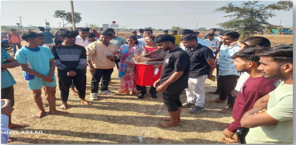
कबड्डी ( पुरुष )